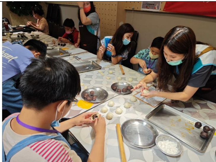
蛋黃酥課-富邦志工協助學員麵團包入餡料。