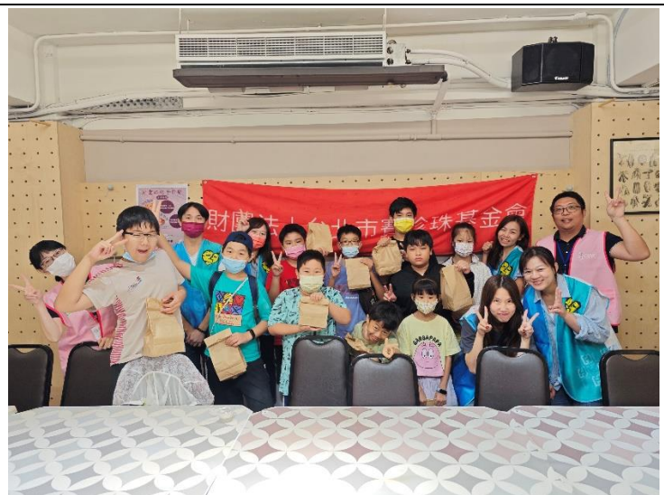
蛋黃酥課-全體學員與富邦志工大合照