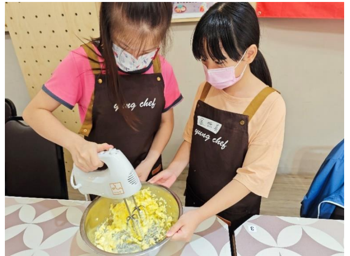
第一堂課學員們操作機器打發奶油。