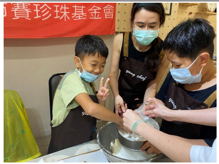
擠花餅乾課-富邦志工協助學員麵粉過篩。