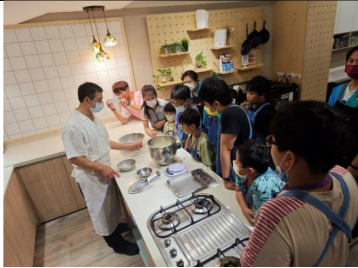
第二堂蛋黃酥課講師講解需要的材料及步驟。