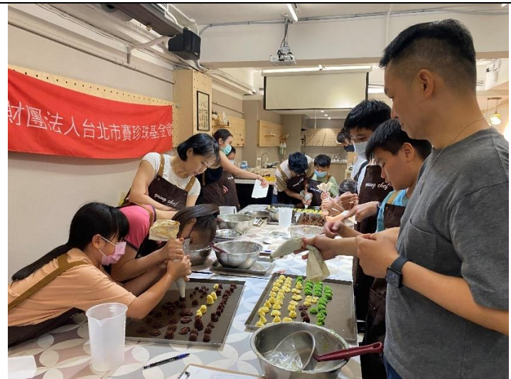
擠花餅乾課-富邦志工們協助學員擠花至烤盤