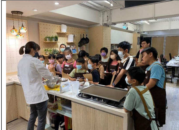
第一堂擠花餅乾課講師示範作法及需注意步驟。