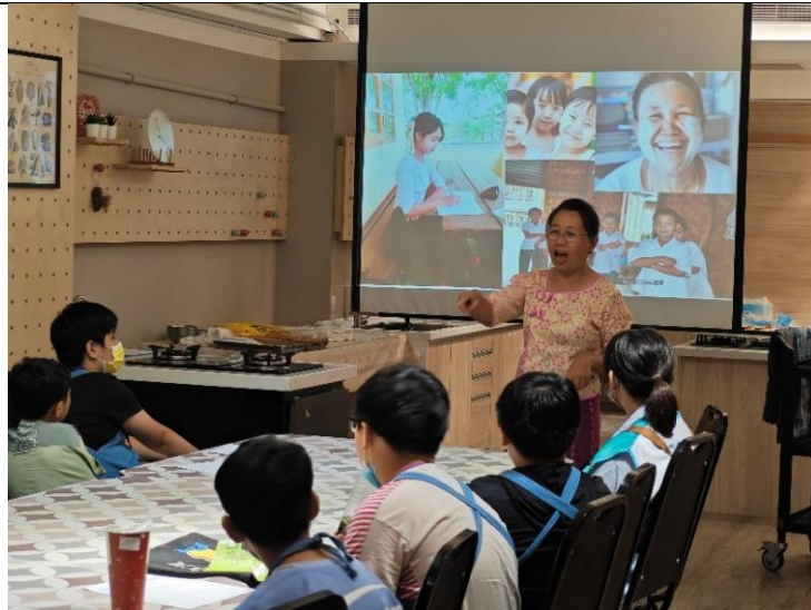
第二堂多元文化課程-緬甸籍講師分享緬甸文化