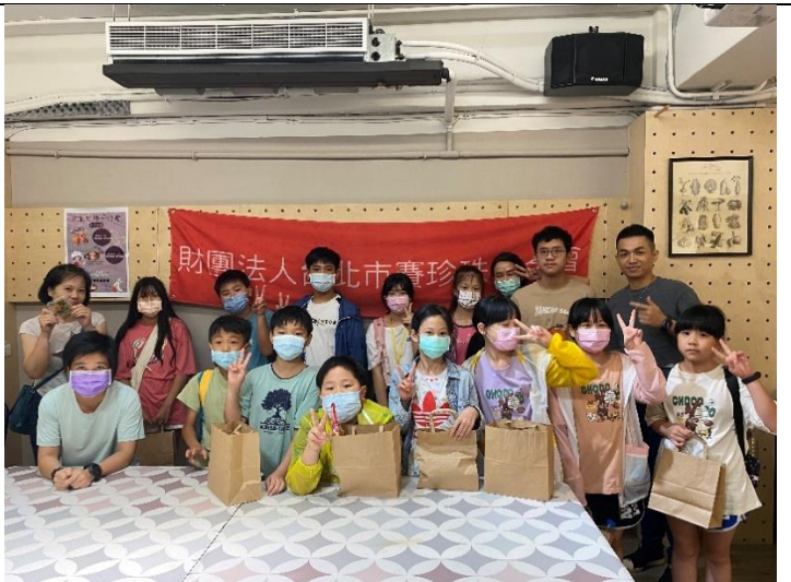
擠花餅乾課-全體學員與富邦志工大合照