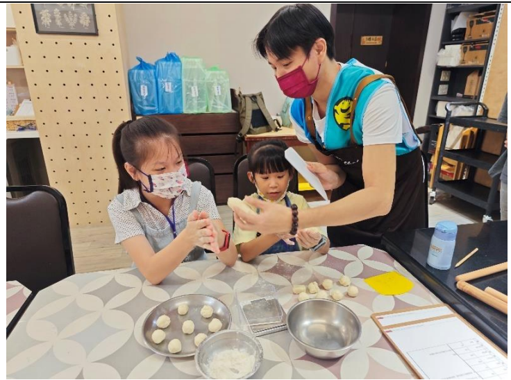
蛋黃酥課-富邦志工協助學員麵團分秤。