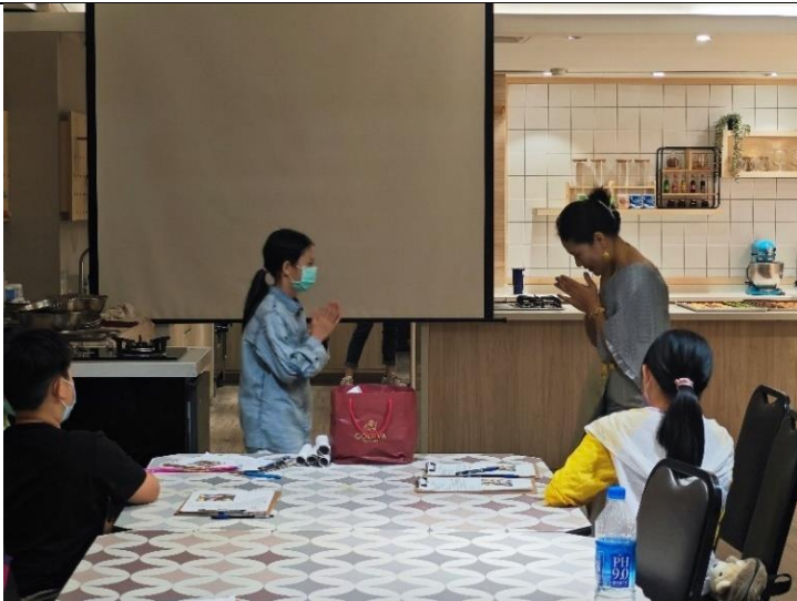
第一堂多元文化課程-泰國籍講師與學員互動。