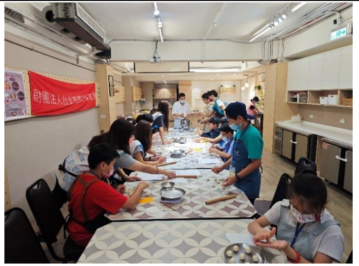
第二堂課學員們操作麵團秤重及揉型。