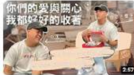
不只是一張紙，上面承載了大人對我的愛與關心 | 還是什麼東西Podcast 觀看次數：13次，2個月前