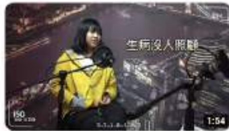
【還是什麼東西】你聽見失去他的聲音了嗎？ 觀看次數：40次，6天前