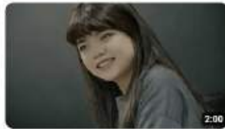
【CGSAXMAKE UP FOR EVER】公益彩妝課- 臉上的自信與美麗 觀看次數：38次，1個月前