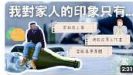
這瓶是母親的壽星，而我是壽星...|還是什麼 東西Podcast 觀看次數：36次，1個月前