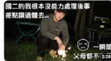
國二是我最無助的時光 | 還是什麼東西 Podcast 觀看次數：12次，2個月前