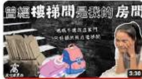
那段推不了家門的日子，是怎麼渡過的？ | 還是什麼東西Podcast 觀看次數：5次，1個月前