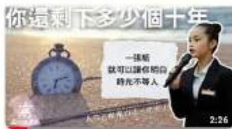
別在奮鬥的年紀懂得妥協，剩下的時間根本不多 | 還是什麼東西Podcast 觀看次數：11次，1個月前