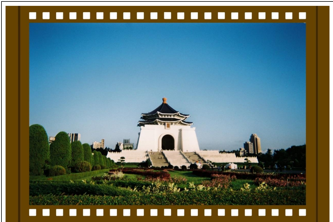
圖 1 無家者攝影展酷卡作品正面