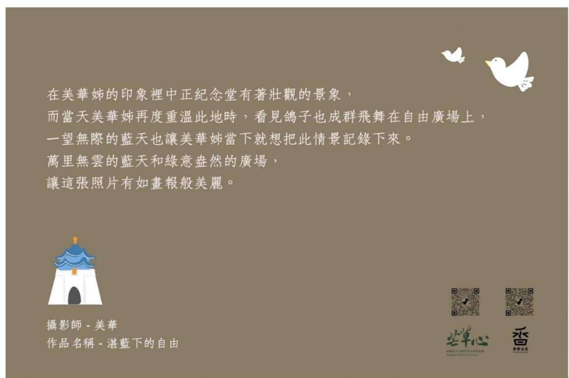
圖 2 無家者攝影展酷卡背面