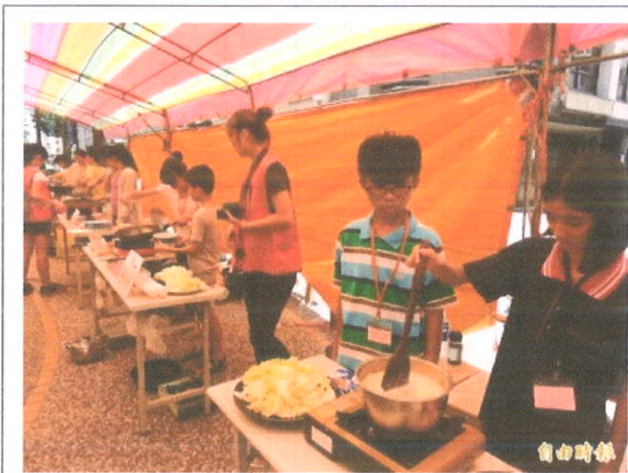
弱勢學童進行廚藝比賽，做菜給家長吃。（記者張菁雅攝）

〔記者張菁雅／台中報導〕弱勢兒童常因家長工作忙碌，用餐時間不正常，中華民國婦幼關懷成長協會教導弱勢學童烹飪，並在今天舉辦「小小廚神料理大賽」，學童必須自行採買食材、做菜、收拾場地，最後與家長一起用餐，家長吃到孩子親手做的菜，都大讚「真好吃」。