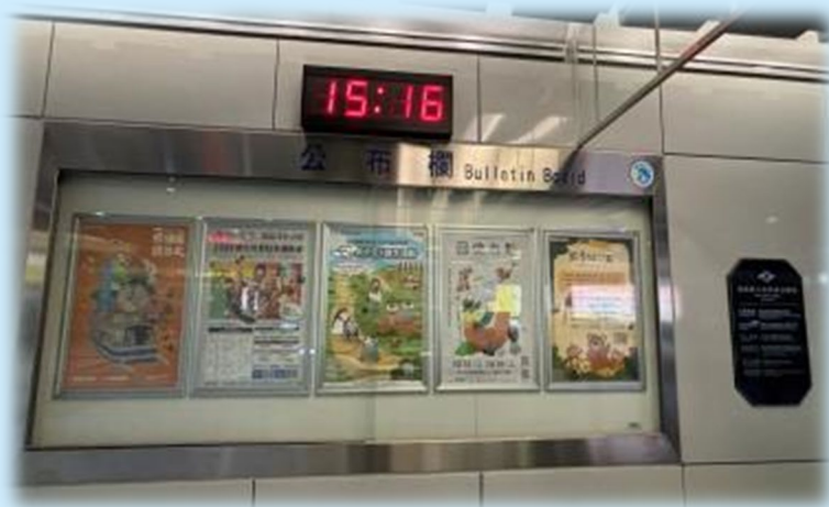
臺北大眾捷運股份有限公司 文宣品核准通知