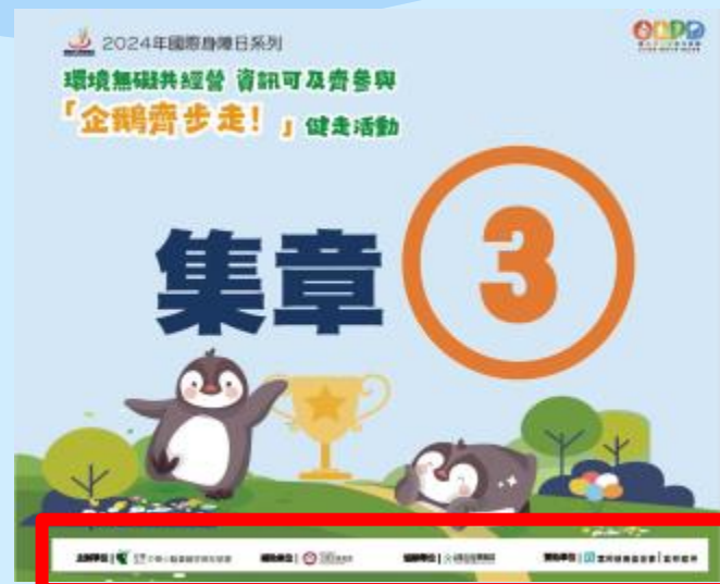
▲健走集章一領隊旗